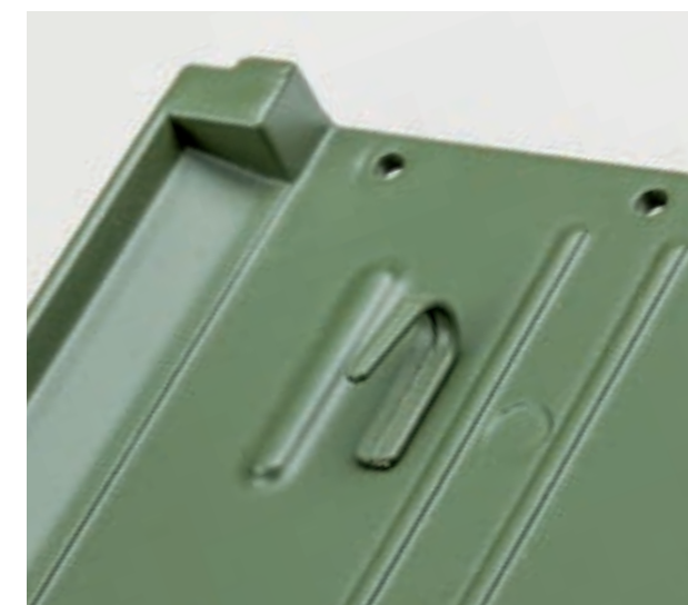
Задний борт прицепа с установленными петлями и крюками тента

Шаг 3. Аналогичным образом закрепите второй крюк тента в левой верхней части заднего борта прицепа.